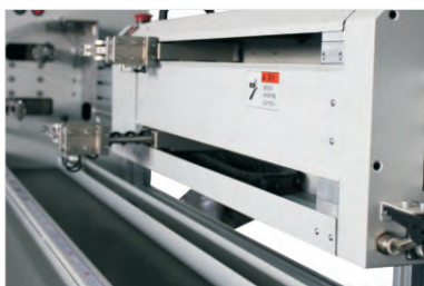
双工位 Double Station