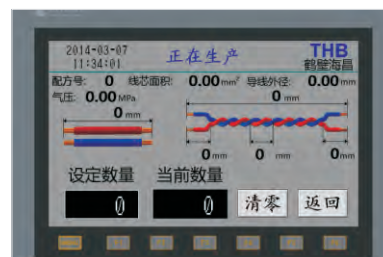
人机交互界面HMI Human-Machine Interface HMI