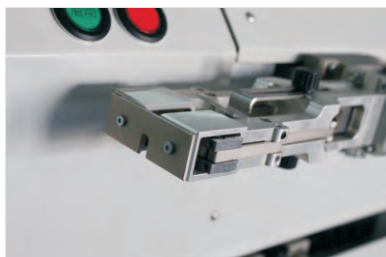
夹线组件 Wire Clip Kit